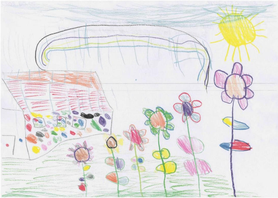
„Junas Haus mit Sonnenkollektoren steht an einer Blumenwiese bei Sonnenschein und Regen unter einem Regenbogen“