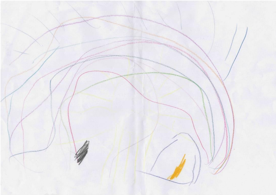
6. Platz: Ylva Sch.