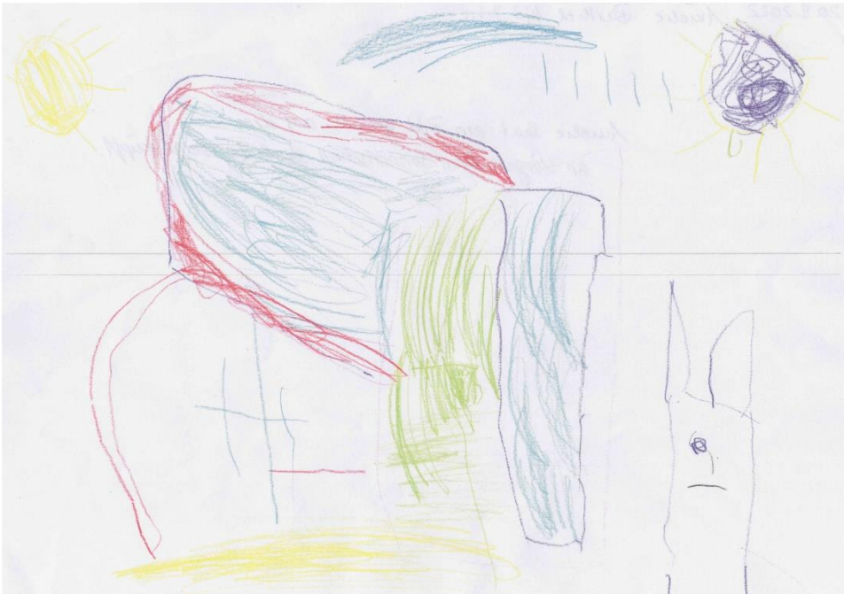
„Amelie hat ein Bild gemalt, auf dem ein Känguru beim Sonnenschein durch die Berge hüpf.“