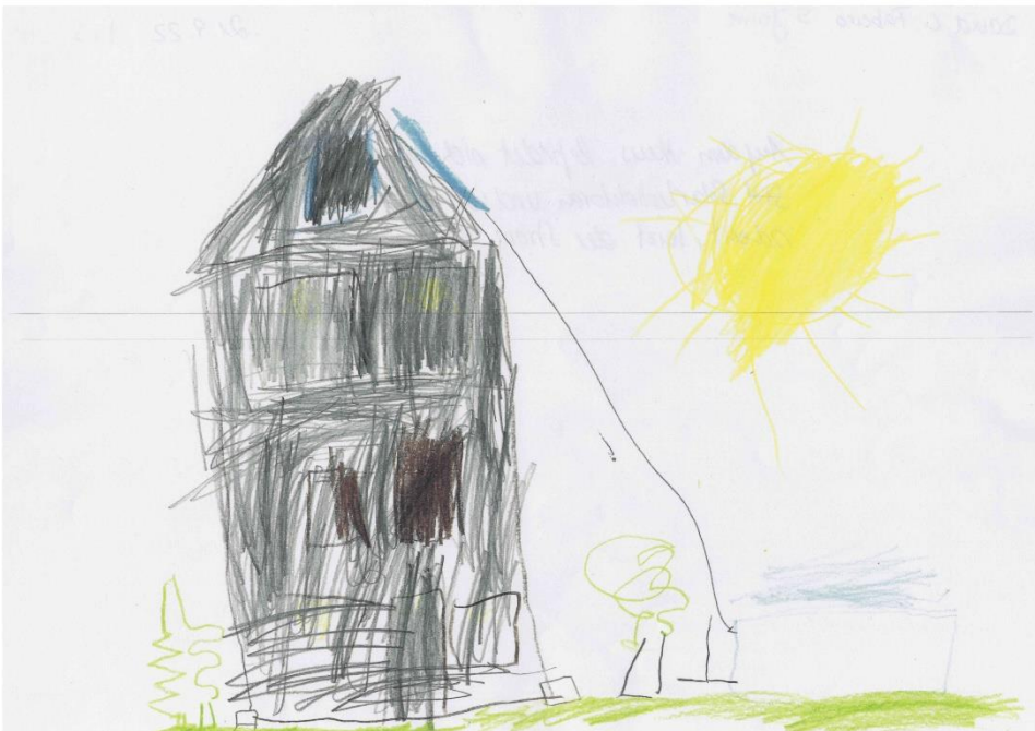
„Auf dem Haus befinden sich meine Solarkollektoren und wenn die Sonne scheint, heizt der Strom meinen Pool“